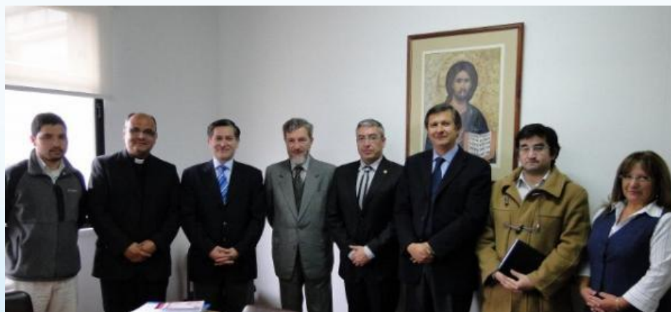
Centro de Humanismo Integral Concepción-Chile

CORPORACIÓN EDUCACIONAL BERNARDO LEIGHTON G.